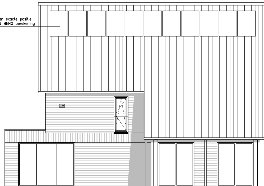
linker zijgevel type D1-P08 / P14 kavel indicatief schaal 1:50

aantal en exacte positie volgt uit BENG berekening