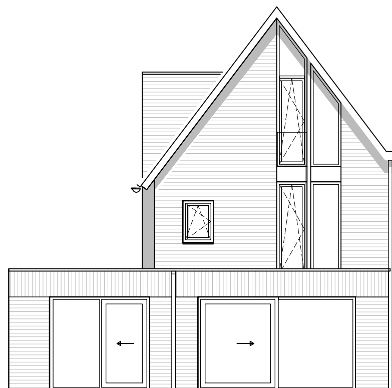
achtergevel type A-P01 kavel indicatief schaal 1:50